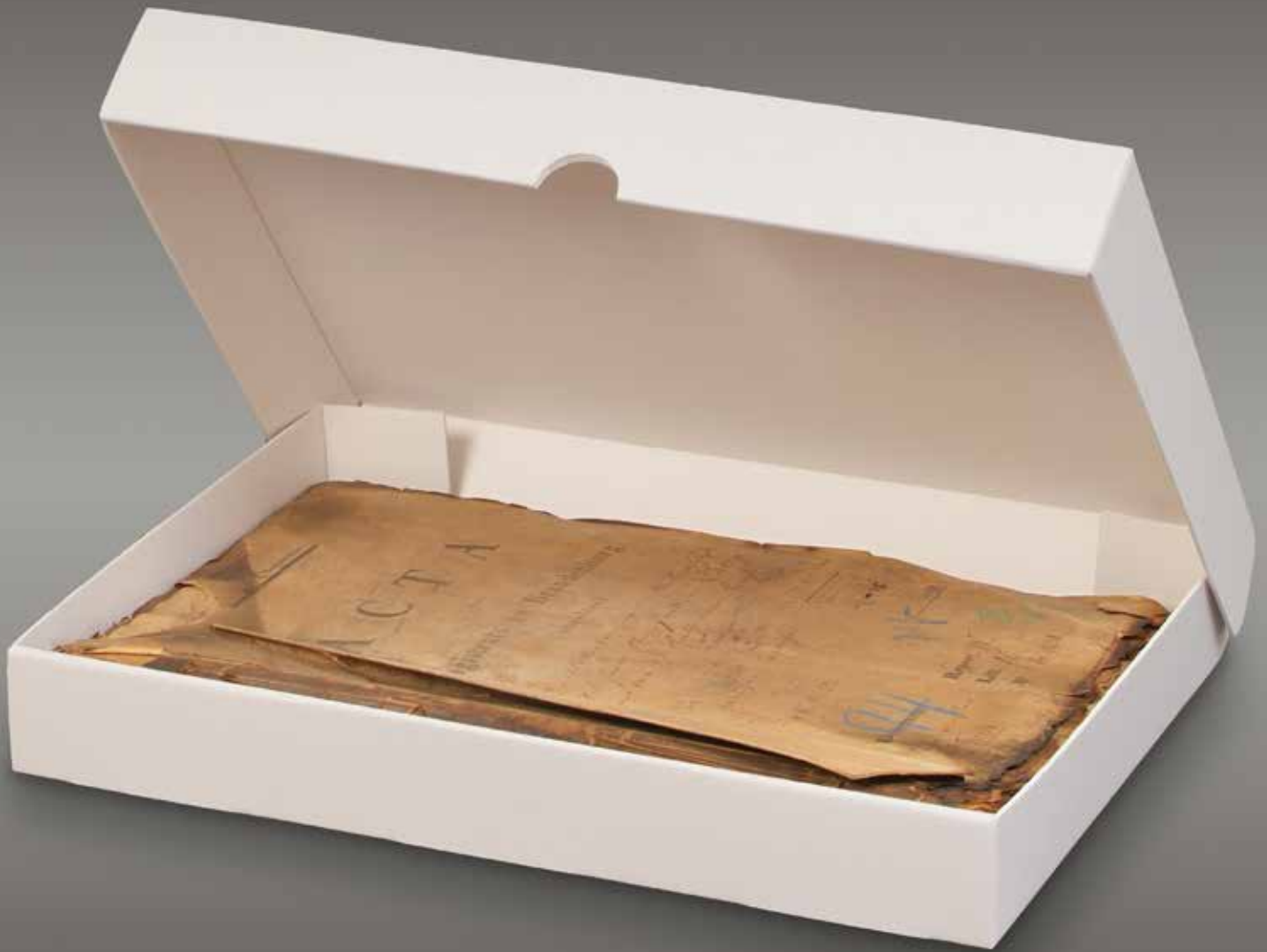
oben: SB 31 aus E-Welle 1,6 mm grau/weiß unten: SB 31 aus E-Welle 1,6 mm grau/weiß